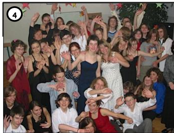
4 NAWET PO ODBYCIU POŁOWY KARY NIC WSKAZYWAŁO NA RESOCJALIZACJĘ SKAZANYCH.