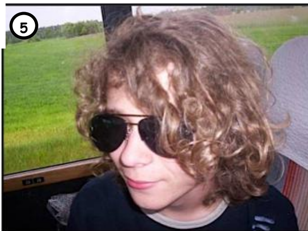
5 ZAMASKOWANI WIEŹNIOWIE WYMYKALI SIĘ Z ZAKŁADU I POPEŁNIALI KOLEJNE WYKROCZENIA.