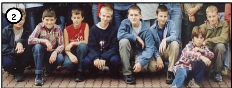
2 KIEROWNICTWO MIAŁO NADZIEJĘ NA POPRAWĘ WIEŹNIÓW, JEDNAK WŚRÓD NICH WYRÓŻNIAŁA SIĘ GRUPA WYJĄTKOWO AGRESYWNYCH ŁOBUZÓW.