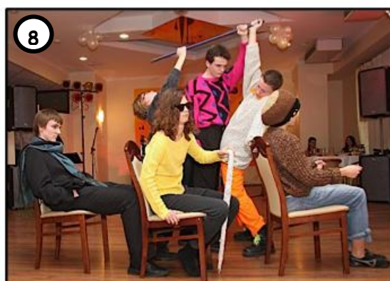
8 ...DOPUSZCZALI SIĘ PRZESTĘPSTW W MIEJSCACH PUBLICZNYCH.