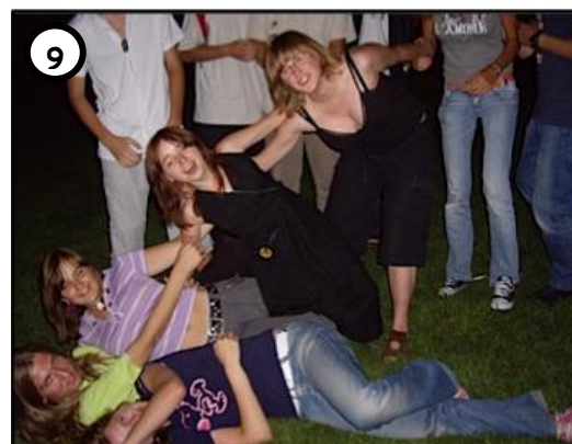
9 PROWADZILI HULASZCZE ŻYCIE...