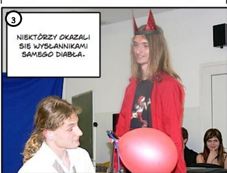
3 NIEKTÓRZY OKAZALI SIĘ WYŚŁANNIKAMI SAMEGO DIABŁA.