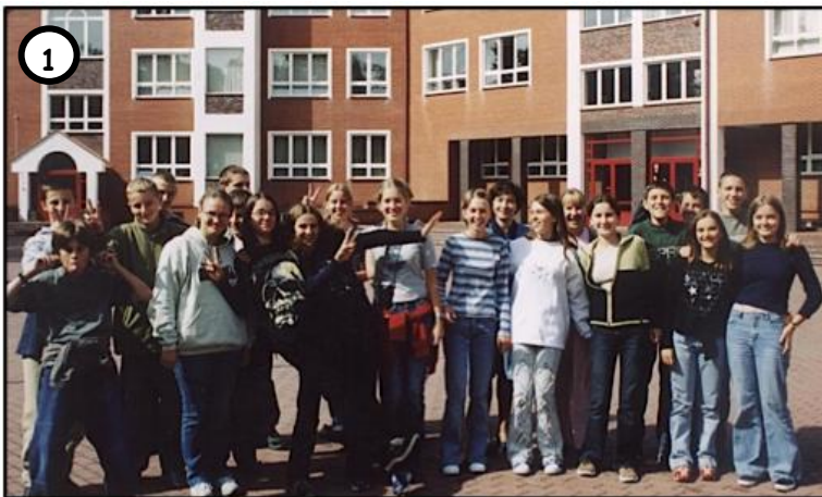
1 W ROKU 2003 GRUPA MŁODOCIANYCH PRZESTĘPCÓW ZOSTAŁA UMIESZCZONA W CENTRALNYM ZAKŁADZIE KARNYM GILĄ.