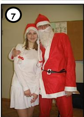
7 PRÓBOWALI UZYSKAĆ PŁATNĄ PROTEKCJĘ...